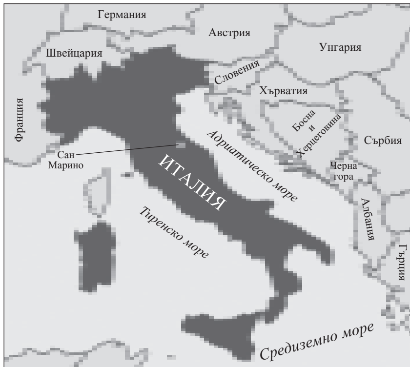
Италианската република и съседните ѝ страни