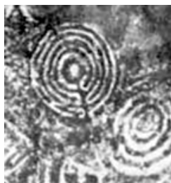
Фиг. 6. Северна Англия 3030 г. пр.Хр.