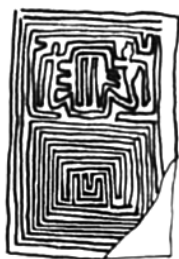
Фиг. 7. Египет, 2300 г. пр.Хр.