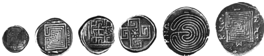
Фиг. 9. Монети от Кносос (Крит, V – IV в. пр.Хр.)

И ето че започват да се раждат един след друг въпросите... Ако първият, Критският лабиринт от мита, е бил едноходов, защо му е била необходима на Тезей нишката на Ариадна?