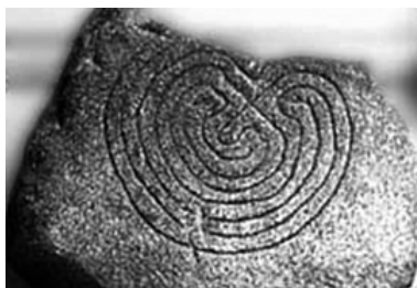
Фиг. 8. Ирландия, Холивуд Стоун, 2000 г. пр.Хр.

ски“ заради свързания с него мит. Съвсем логично откриваме неговото изображение не другаде, а върху критски монети от V – IV в. пр.Хр., като паралелно с тях вървят в оборот и монети със стилизирана свастика, Минотавър и бича глава. На фиг. 9 можете да видите образци на сребърни монети от Кносос. Лабиринтът е представен в два варианта, ъгловат и закръглен, като понякога е изобразен не самият лабиринт с коридорите си, а пътят в него (образец № 2 и № 6) – което е още едно доказателство за важноста на този символ (и особено на преминаването през него).