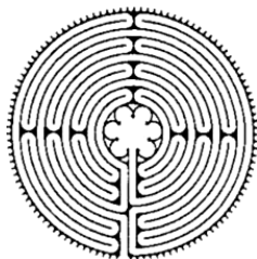
Фиг. 2. Схема на лабиринта в катедралата Нотър Дам дьо Шартър

ховността на човешката природа, или пък като запознаване с някакво скрито познание и послание, каквито предположения също има. Всички камъни и всички елементи, съставлящи лабиринта в Шартър, са преброени от изследователите му, а стройната система от цифрови съотношения намира различни тълкувания, в които освен религиозни не липсват в последно време и някои езотерични идеи.