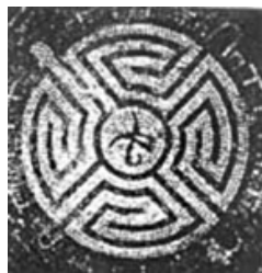
Фиг. 5. Авентикум, Швейцария, III в., с рог на Минотавъра и ласото на Тезей в центъра