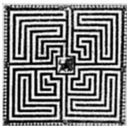
Фиг. 3. Пиадена, Италия, I в., с умиращия Минотавър в центъра

И тъй, видяхме как Средновековието е трансформирало представата за лабиринта, наследен от късната античност. Пътувайки назад във времето, стигаме до разцвета на Римската империя. На фигура 3, 4 и 5 виждате образци от мозайки, украсяващи подове в римски вили – както сами можете да се убедите, пътят в тези лабиринти не дава възможност за избор, той е само един.